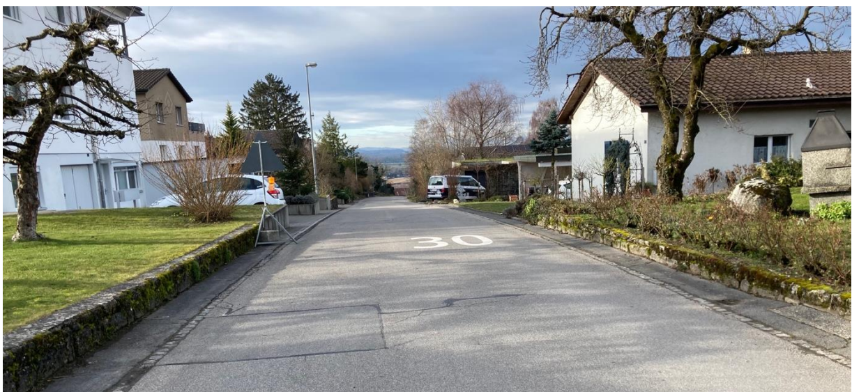
Östlicher Abschnitt des Böblerenwegs – Blick vom St. Jodelweg

Die Erneuerung der Wasserleitungen und der Kanalisation werden über Gebühren finanziert. In den Spezialfinanzierungen sind die entsprechenden Rückstellungen vorhanden. Von den Gesamtkosten entfällt nur ein Anteil von CHF 585'000.-- auf den allgemeinen Steuerhaushalt.