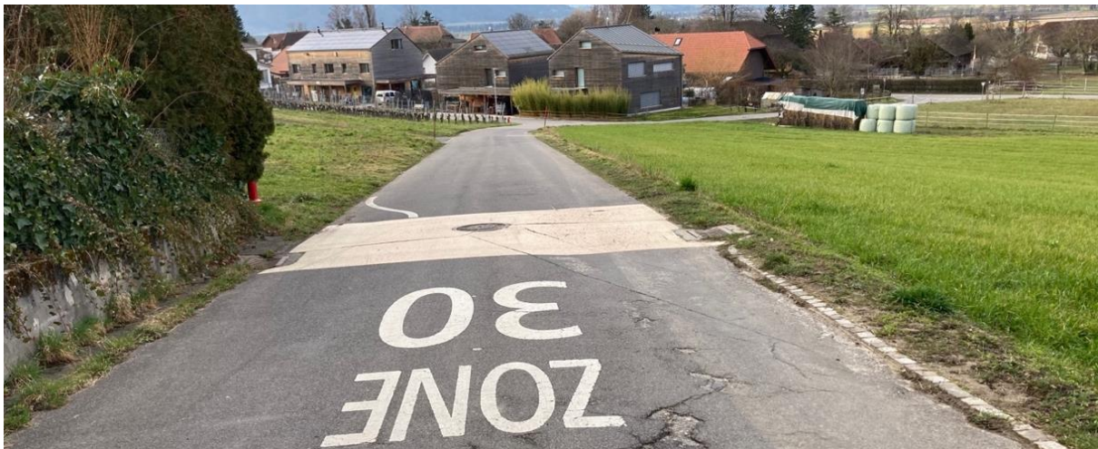
Westlicher Abschnitt des Böblersenwegs – Blick auf die Abzweigung Sonnhalde und die Einmündung in die Erlachstrasse

Zur Erschliessung der Böblersen und oberen Breiten als Wohnzone wurden vor gut fünfzig Jahren die alten Feldwege ausgebaut und neue Werkleitungen eingelegt. Auf der bestehenden Strassenoberfläche wurde als Tragschicht Mergel eingebaut und mit einem Bitumenbelag versehen. Sondierungen zeigen, dass auf der ganzen Länge ein tragfähiger Strassenkoffer fehlt. Die Strasse hält dem heutigen Verkehr nicht mehr stand. Sie wird übermässig belastet und zunehmend beschädigt.